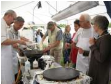
(Billedet er fra Sommerstævnet 2012, hvor Købnerkirken stod for cafeen)