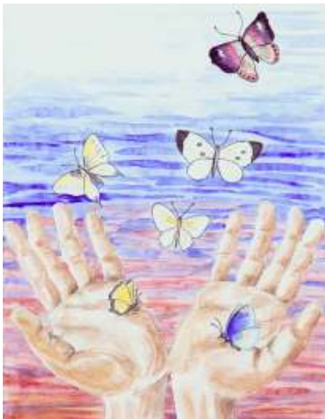
Billede malet af Dorthe Kornholt

Ingen har nogen ret til mig, ikke én. Ingen må tage mit liv fra mig.