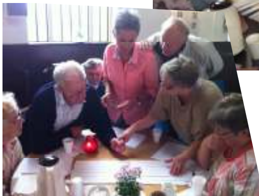
Der tænkes... der debatteres... der arbejdes med spændende tanker ved alle bordene