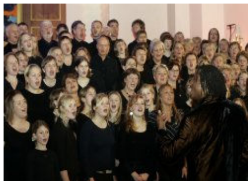
Foto: Lidt snyd, men en forhåbning om, at det er sådan her, det kommer det til at se sådan ud i Købnerkirken, når det nye gospelkor synger.

www.amargospelkor.dk , for en sådan er nemlig allerede oprettet!